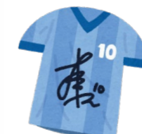
【1階 スタジアムギャラリー】

メインスタンドの観客席に座っていただき、スタジアムの概要説明を15分ほど行います。