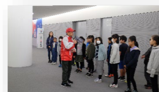
【B2階 フラッシュインタビューゾーン】

選手と同様にピッチへ入場し、選手になった気分を味わうことができます。 ※芝生には入れません。