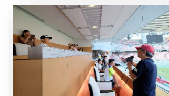
【1階 貴賓室・特別観覧席】

※Bコース、スペシャルコースのみ 国際大会などで皇族や各国大使がご利用になる特別観覧席および会食などで使用される貴賓室に入ることができます。